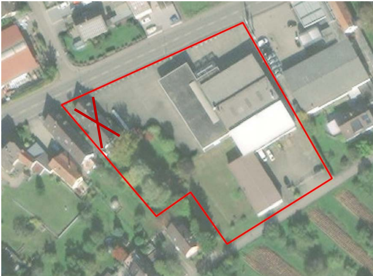
Abb. 1: Lage des Plangebietes (rot umrandet)

Das Plangebiet ist in Abb. 1 dargestellt und nimmt eine Fläche von rund 0,68 ha ein. Das Untersuchungsgebiet entspricht dem Plangebiet.